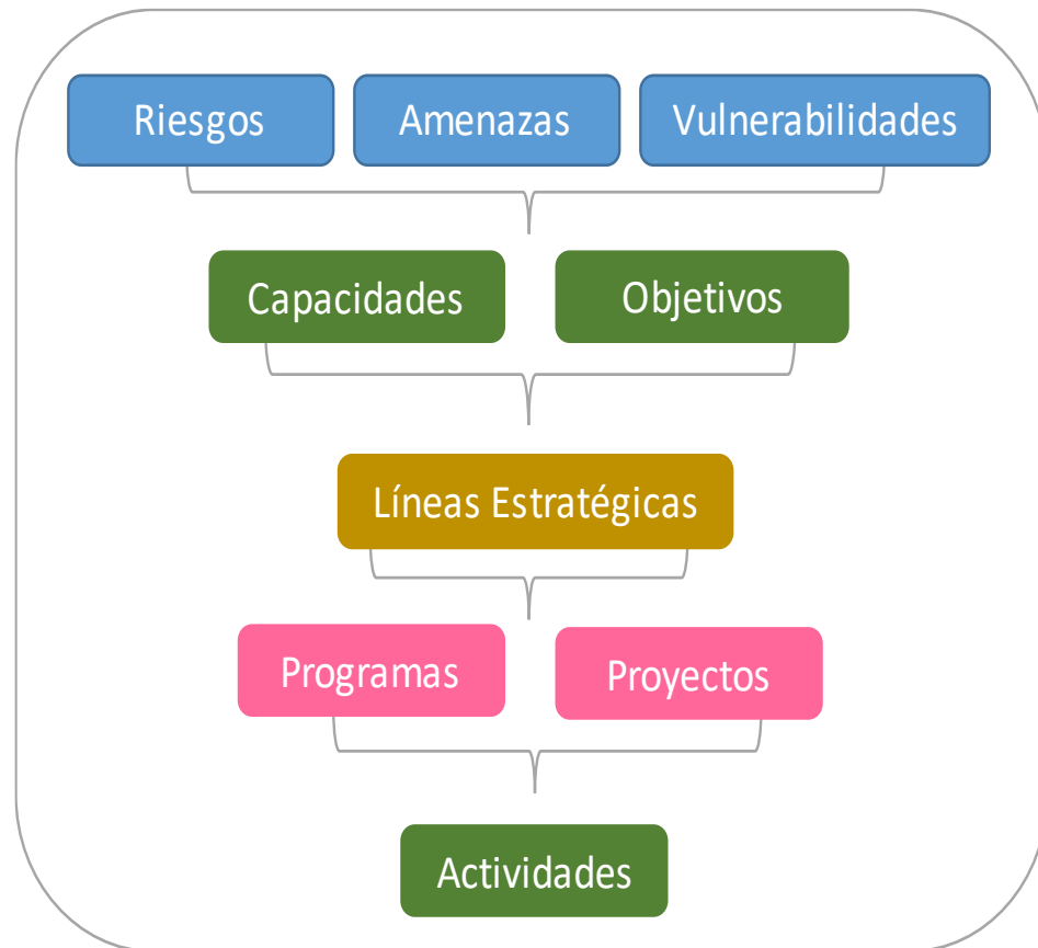
Cadena de valor 1.